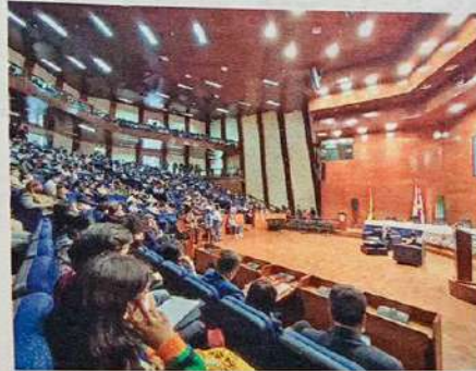
ASISTENCIA. Así lucía parte del auditorio del OICC Ayop, durante la primera conferencia magistral.

Dijo que con estos métodos alternativos, "el 50% de los casos